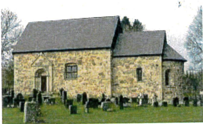
Gamla Hjelmseryds kyrka och gästhem

Om man kör bil är det väldigt lätt att hitta hit. Riksväg 30, vägen mellan Jönköping och Växjö, 7 km söder om Vrigstad. När du kommit in i Gamla Hjelmseryd ska man svänga mot Söndra, där är det också skyltat kulturminne och vandrarhem. 50 meter in på den vägen svänger man igen, åt höger, även denna gång är det skyltat kulturminne och vandrarhem. Då kommer man fram till vår och kyrkans parkering.